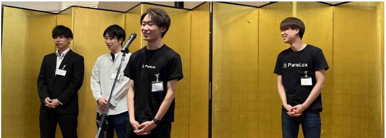
▲ 初参加企業・株式会社ParaLuxの紹介