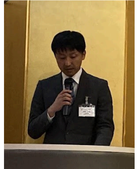
▲ 笹谷八幡分会長による 司会進行