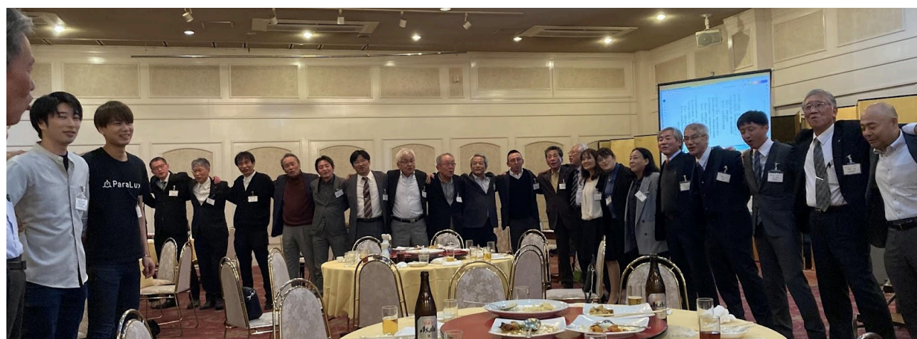
▲ 巻頭言の後は肩を組んで学歌斉唱