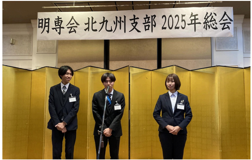
▲ 工大祭実行委員会による活動紹介