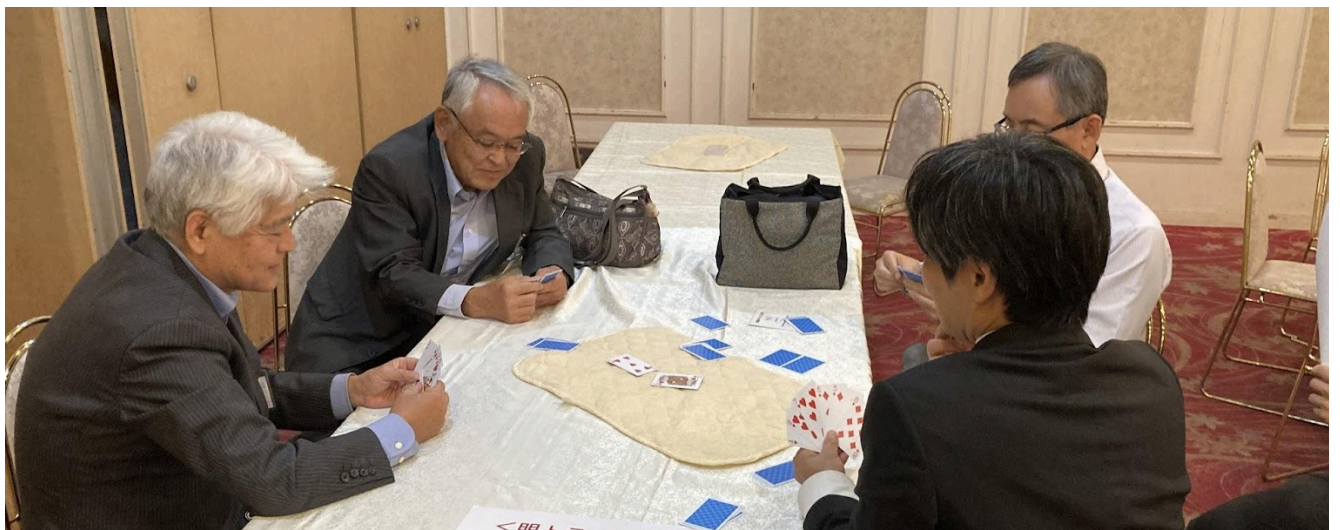
▲ 総会開始前の明トラ練習会