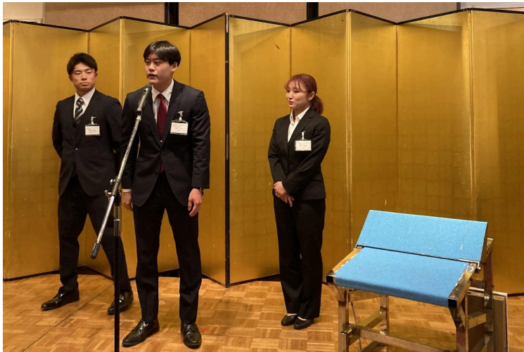
▲ 水泳部による活動報告