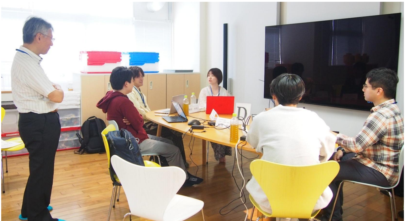
▲ グループ討議の様子