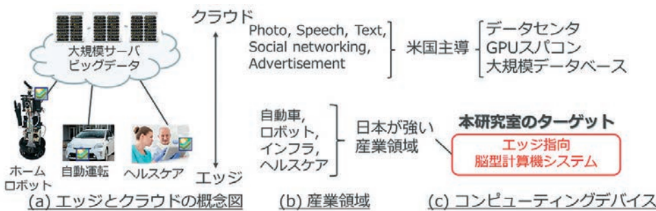
図1 本研究室が狙うエッジ指向脳型計算機システム

ピューティングデバイス観点でも、GPUやデータベースなどの技術開発においても日本はもはや太刀打ちできる状況ではありません。一方で産業の観点から我が国を見直すと、自動車やロボットなど、世