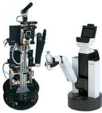
図2 @ホームロボット 左: Exi@、 右: TOYOTA HSR

するというコンセプトの下で設立されたリーグになります。九州工大の Hibikino-Musashi@Home チームは世界大会三連覇を筆頭に、Japan Open の二年連続実機二冠優勝など、@ホームリーグの強豪校として世界中にその名を知られています。本学広報誌 Ambitious などでの成果が取り上げられておりますので、是非、WEB からご覧いただくと幸いです。 図2は我々が開発する@ホームロボットです。このプラットフォームを活用して、ロボットミドルウェアのデファクトスタンダードである Robot Operating System (ROS) から FPG A 内部の知的処理回路へと自在にアクセスする ROS-FPGA を提案し、ROS のトップ国際会議である ROSCon 2017 に日本の