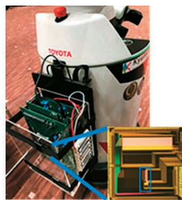
図3 脳型チップ搭載 TOYOTA HSR

さらに、深層学習の次を狙う研究開発として、海馬・扁桃体・前頭前野を融合した脳型人工知能の実現を進めています。図4は家庭での典型的コミュニケーション例です。人間は家族との会話や思い出から「アレ」を推定でき、この実現には、海馬でのエピソード記憶形成や扁桃体での価値判断が大きく関わっていると言われています。一方「アレ」に関する知識はユーザや環境依存でビッグ