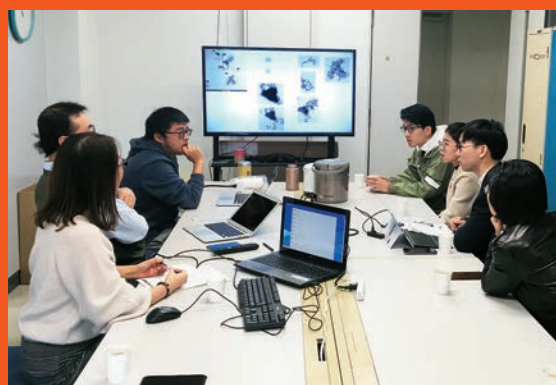
揚州大学化学化工学院との研究交流 (さくらサイエンス)