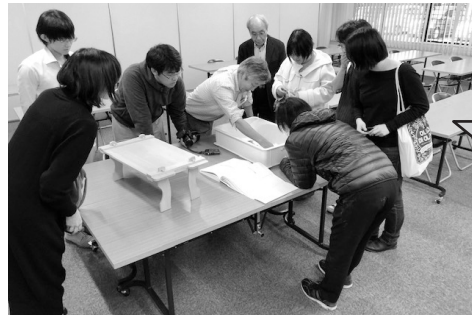
▲この地域の弥生時代の遺跡を見直すきっかけになりました。遠方からの調査お疲れ様でした。

2月6日(水)黒田小学校3年生の32名が「昔の道具」について学習しました。校区内の「黒田エノヲ遺跡」から出土した約2000年前の土器には、現在の技術でも復元できないものも含まれ、当時の技術の高さに驚きの連続でした。