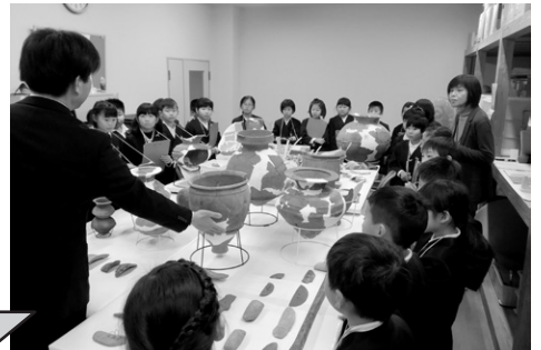
▲校区内の地下から出土した2000年前の道具に興味津々。ご先祖様が使っていたもの?