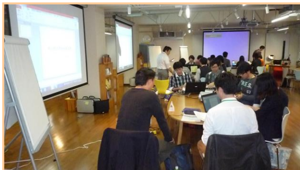
▲「グループ討議の実践」の様子 グループ毎の討論の様子(D~F班)