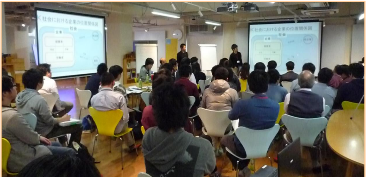
▲ 「グループ討議の実践」でのプレゼンの様子