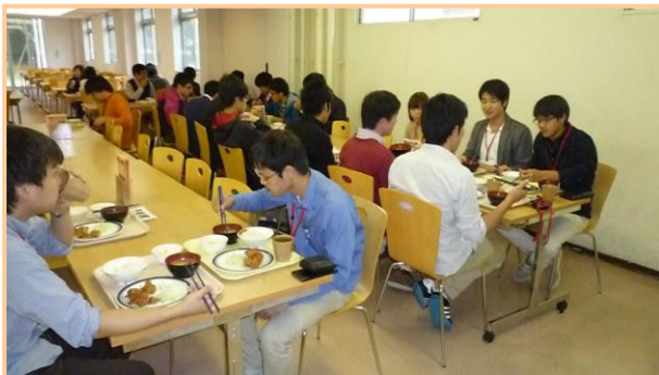
▲ 昼食の様子 (生協食堂)