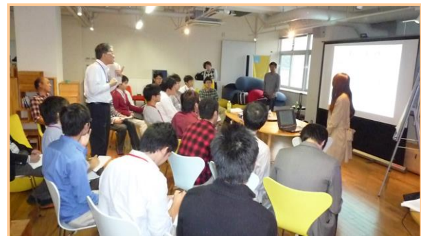
▲「グループ討議の実践」の様子 1回目のプレゼンの様子(A~C班)