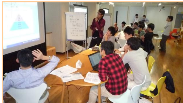
▲「グループ討議の実践」の様子 グループ毎の討論の様子(A~C班)